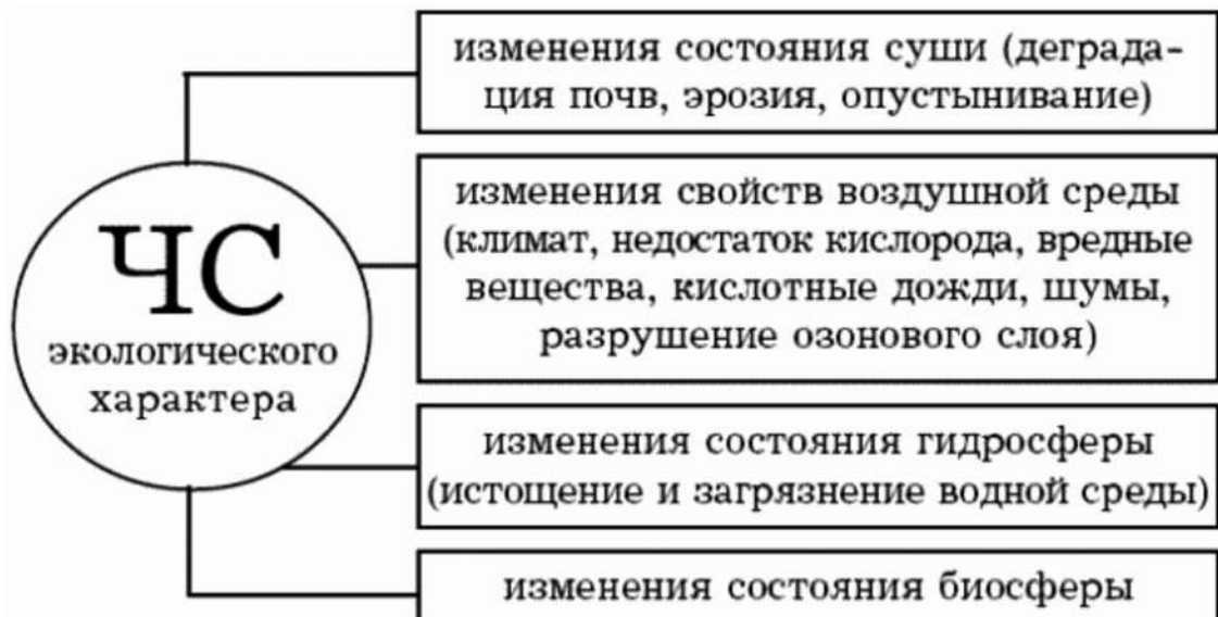
Рис. 3. Классификация ЧС экологического характера