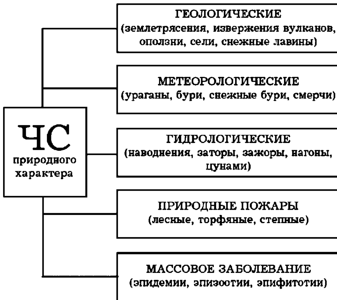
Рис. 1. Классификация ЧС природного характера

Различают природные (рис. 1), техногенные (рис. 2) и экологические (рис. 3) ЧС.