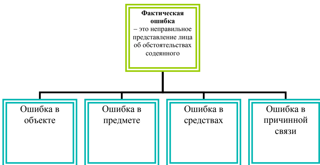
Рисунок 1. Фактическая ошибка