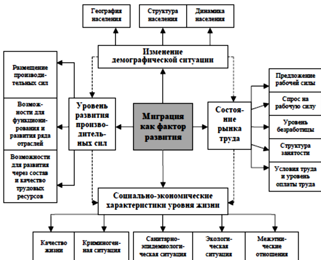
Рис. 1. Влияние миграции на социально-экономическое развитие территорий.

Миграционные процессы играют важную роль как в социально-экономической, так и в общественно-политической жизни страны, регионов, а миграционная политика является одним из направлений государственной политики. Вопросы регулирования миграционных процессов, пресечения нелегальной иммиграции являются актуальными и для местных органов государственной власти. Нами предпринята попытка показать влияние миграции на основные процессы социально-экономического развития, выявить отрицательные и положительные моменты этого явления и обосновать миграцию как один из факторов развития территории. Схематически это выглядит следующим образом (см. рисунок 1).