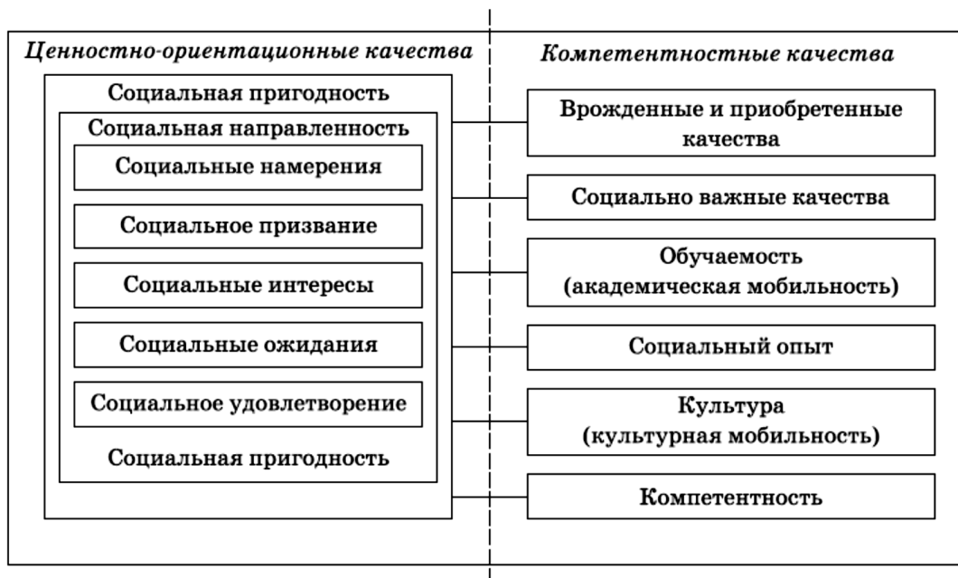
Рис. 4. Комплекс качеств, развивающих внутреннюю потребность индивида, в социальной мобильности (субъективные факторы социальной мобильности – подструктура 2).

Комплекс этих качеств, в свою очередь, разделяется на ценностно-ориентационные, указывающие преимущественно на внутреннюю ориентацию и внутреннюю мотивацию индивида на социальную мобильность; и на компетентностные качества, проявляющиеся в деятельности, на которых базируются социальная (гражданская) и профессиональная компетентности, профессионализм кадров как интегрированные характеристики. Комплекс качеств, внесенных в подструктуру 2, можно характеризовать как социально мобильные качества индивида. Формирование мобильных личностных свойств обусловливается уже известными науке социальными взаимодействиями и закономерностями.