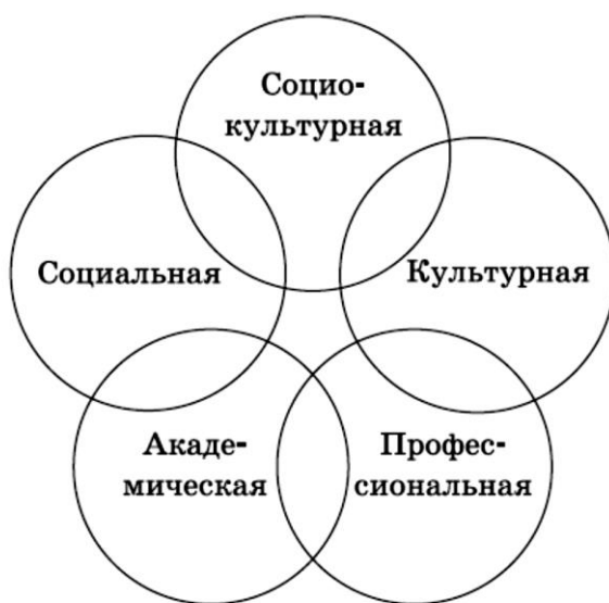
Рис. 2. Взаимодействие видов мобильности (вариант 2)

тивать основные и сопутствующие виды деятельности индивида, их конфигурацию в конкретном ракурсе и моменте исследования (рис. 2).