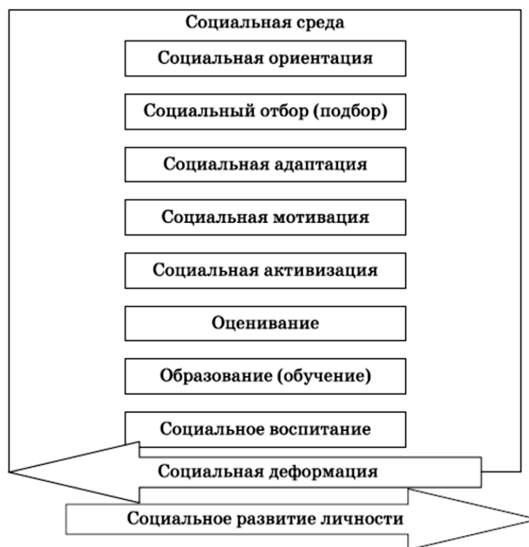
Рис. 3. Объективные факторы социальной среды, в которой развивается или деформируется социальная мобильность индивида, и детерминированные ими функции социальной среды (объективные факторы социальной мобильности – подструктура 1).

нальной и иных сфер деятельности индивида. С позиции процессуального подхода основным процессом влияния социальной среды на индивида является формирование и развитие его социальной мобильности. Этот процесс достигается осуществлением социальной средой комплекса взаимосвязанных функций. Под функцией (от лат. functio – исполнение, осуществление) понимается проявление свойств объекта в системе его отношений. В.С. Леднев указывает, что функция в социологии – роль, которую выполняет социальный институт или процесс по отношению к целому, например, функция государства, семьи и т. д. в обществе 37 . Забегая вперед, подчеркнем, что В.С. Леднев рассматривает понятие «функции системы образования в обществе», что указывает на возможность применения функционального подхода к определению сущности тех или иных социальных институтов. Указанный нами комплекс взаимосвязанных функций социальной среды является необходимым для формирования и развития социальной мобильности индивида.