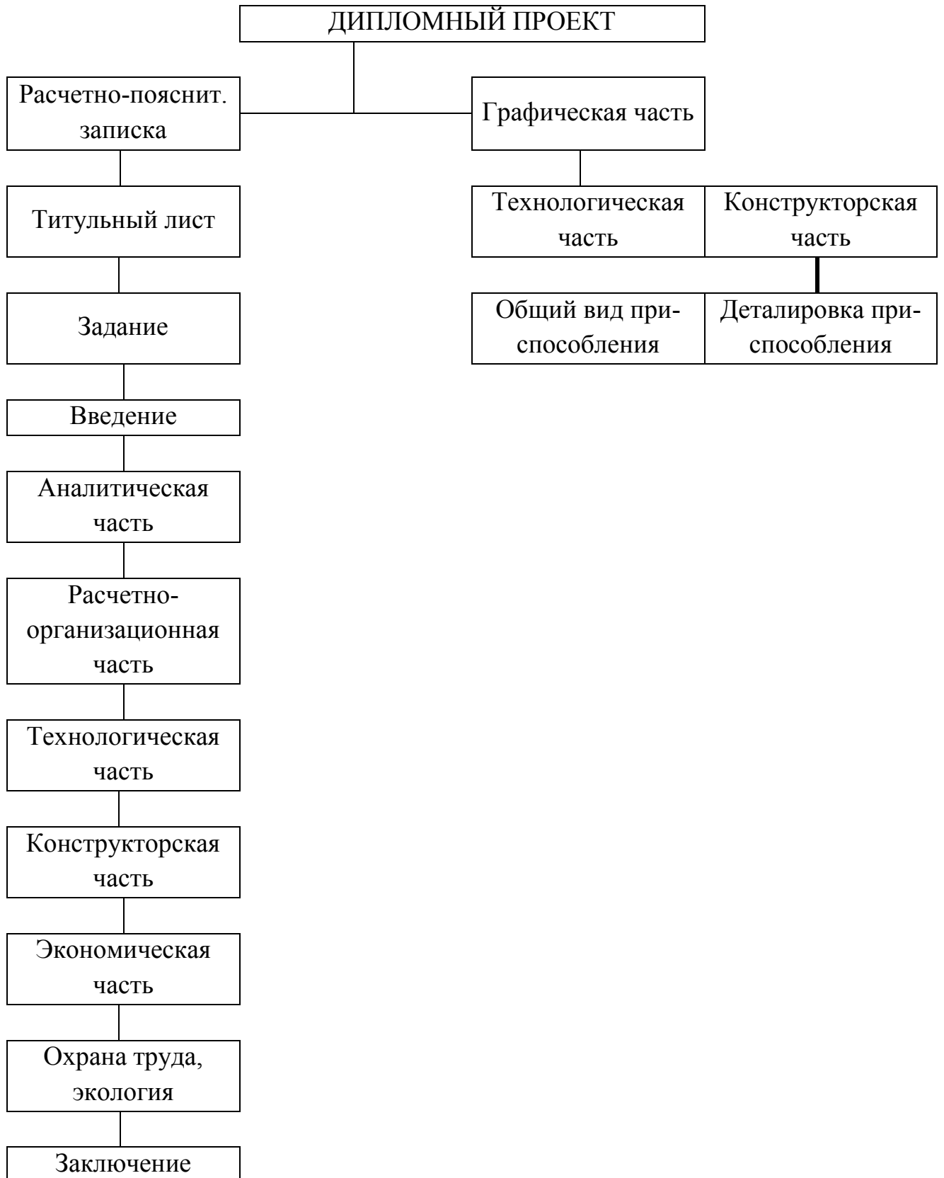
Структурная схема выполнения дипломных проектов