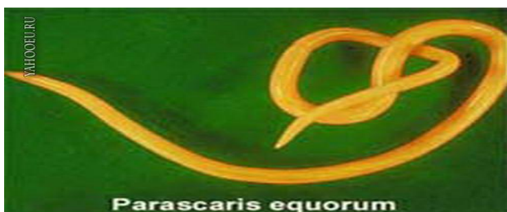
Рис. (номер). Название.

3.9. Все иллюстрации (рисунки, графики, схемы, фотографии и т.п.) именуют рисунками и располагают в тексте непосредственно после ссылки на них и имеют самостоятельную сквозную нумерацию. Как и таблицы, рисунки должны иметь краткую, простую и точную подпись, определяющую их содержание. Подписи помещают с красной строки под иллюстрациями: