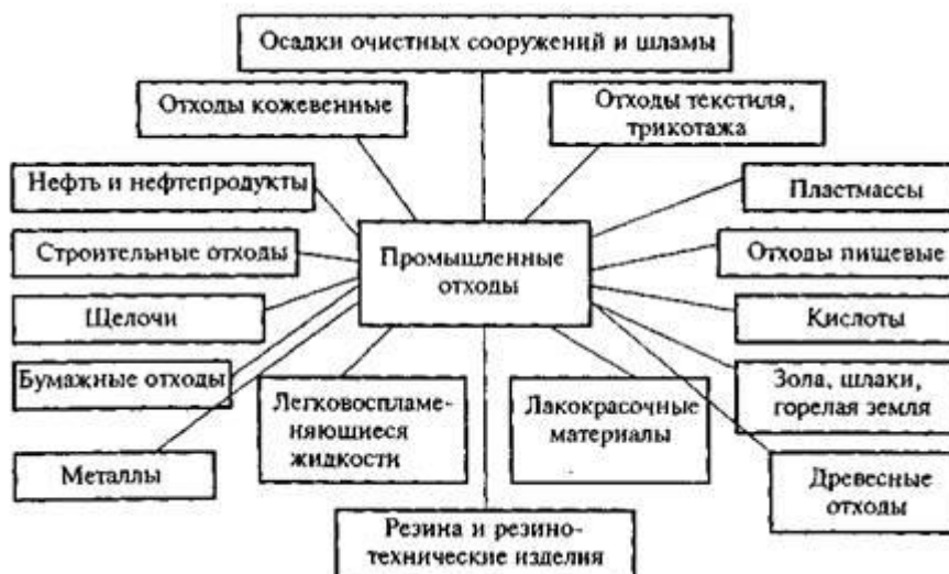
Утилизация промышленных отходов.

Форма отчетности: сравнительная таблица «Виды промышленных отходов»