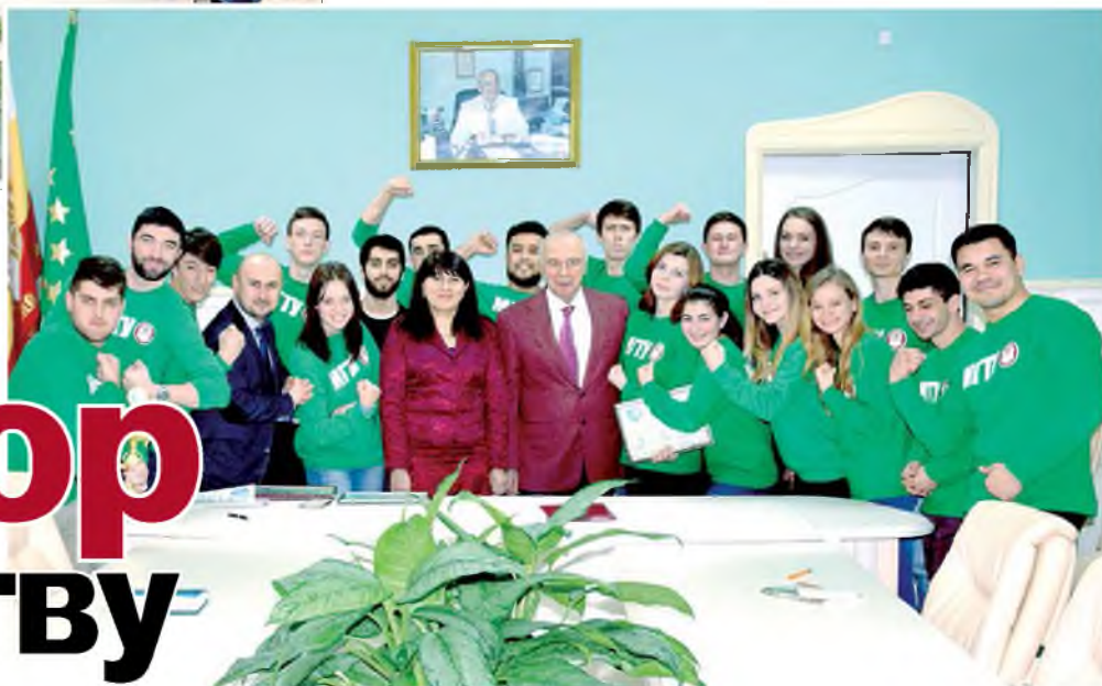
Ректор и президент МГТУ встретились со студенческим активом