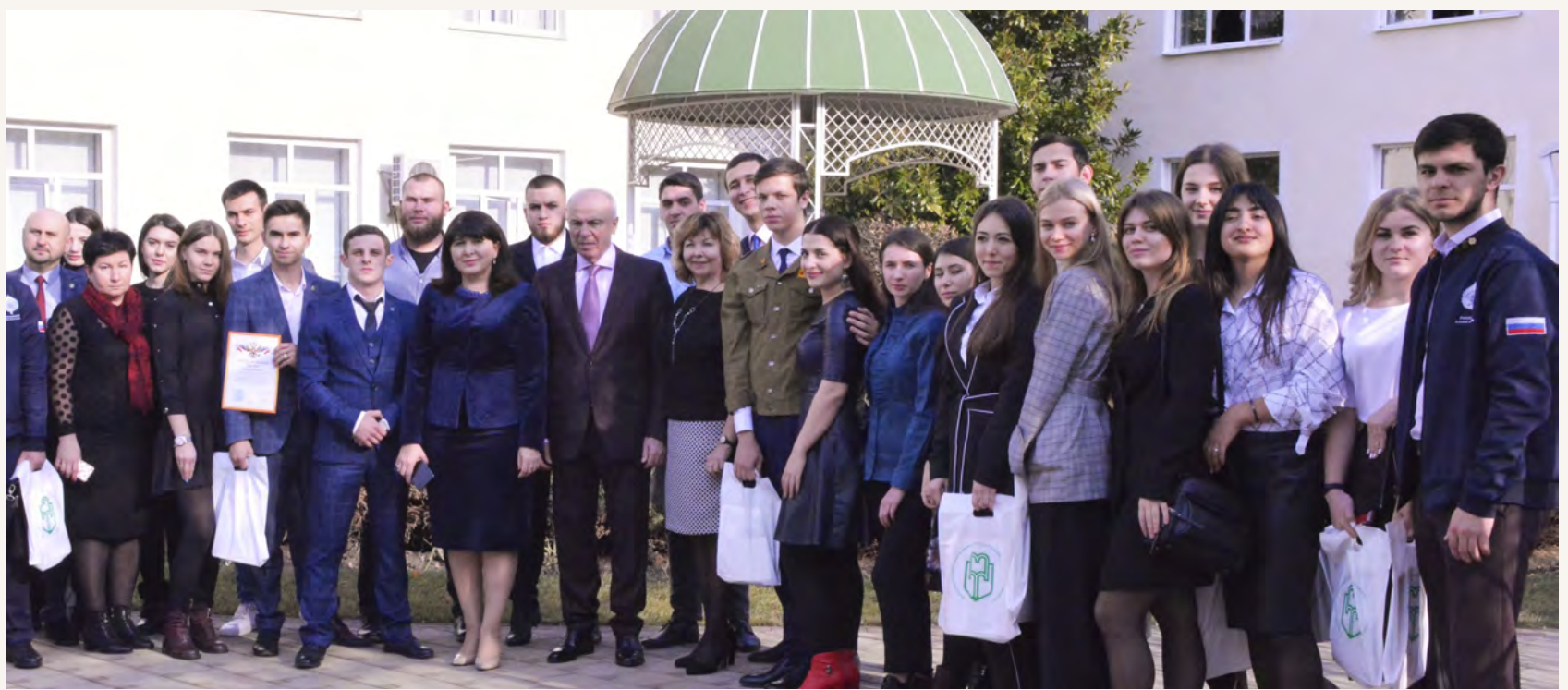
Уважаемые сотрудники, преподаватели, студенты и аспиранты! Дорогие друзья!

25 января отмечается День российского студенчества – Татьянин День. Сердечно поздравляем студентов Майкопского государственного технологического университета всех поколений с этим славным праздником! Желаем студентам, выпускникам, преподавателям успешной реализации личных и профессиональных планов, здоровья и благополучия, оптимизма и счастья!